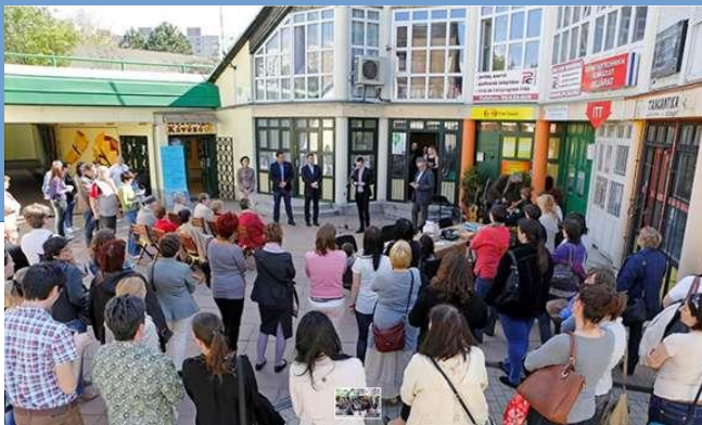
Régi helyszín az egyetem kezében