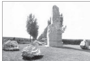
Az álmosdi csata emlékműve

Hetven éve, hogy Álmosd képviselő-testülete Kölcsey Ferenc egykori lakóházának utcáját is a költőről nevezte el, az emlékházban éppen negyven éve az álmosdi csata emléket idéző, pincéjében az érmelléki szőlő- és borkultúrát bemutató néprajzi kiállítás nyílt, udvarházában kapott otthont a községi könyvtár. Az irodalmi zárandokhelyé lett épület azóta is számos nagyszabású ünnepség színhelye volt, kertjében 1975-ben avatták fel Marton László Munkácsy-díjas szobrászművész süttői mészkőből faragott, Kölcsey Ferencről készített mellszobrát, a költő születésének kétszázadik évfordulója 1990. augusztus 8. óta a ház egy megújult Kölcsey-emlékkiállítás színhelye. A falu Kölcsey vonatkozású emlékeinek sorában fontos helye van az 1990-ben műemlékké nyilvánított Miskolczy-kúriának, ahol az 1860-as évektől