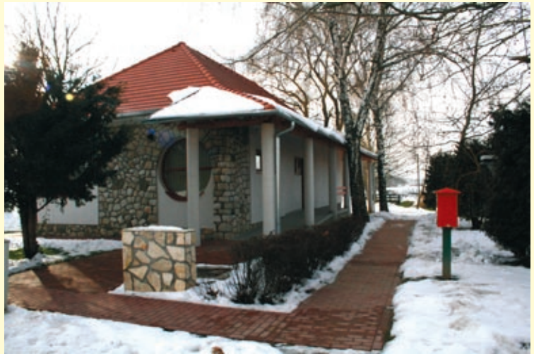
Tavaly decemberben befejeződött az egészségház felújítása, a környékét is rendbe hozták.

A Szin Tér Művelődési Ház valóban színes programok tere, évente több kulturális és ismeret-