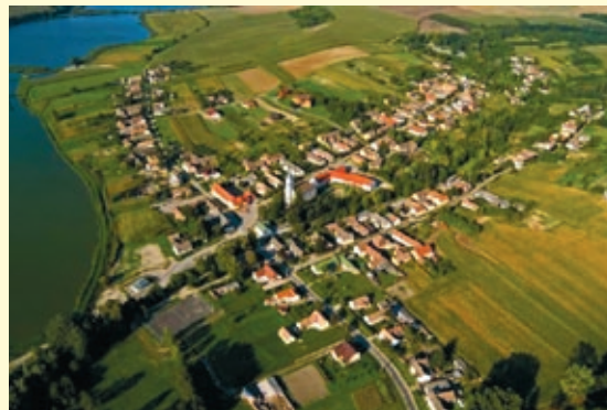
Légifotó: Nem térkép e táj.

A nagyvilág számos helyét bejártam, utaztam földön és levegőben, de úti élményeim nem vetekszenek azzal a semmihez nem hasonlítható érzéssel, amikor hazafelé közeledve a dombról megpillantom szülőfalum képét, hívogató esti fényeit. Alsómocsolád számomra az a hely, ahova jó