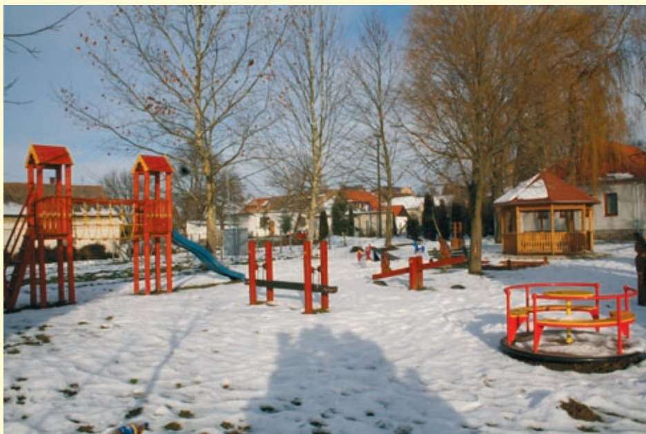
Amikor az uniós követelményeknek megfelelő alsómocsoládi játszótérről elkészült ez a kép, a gyerekek szomszéd település iskolájában és óvodájában voltak.