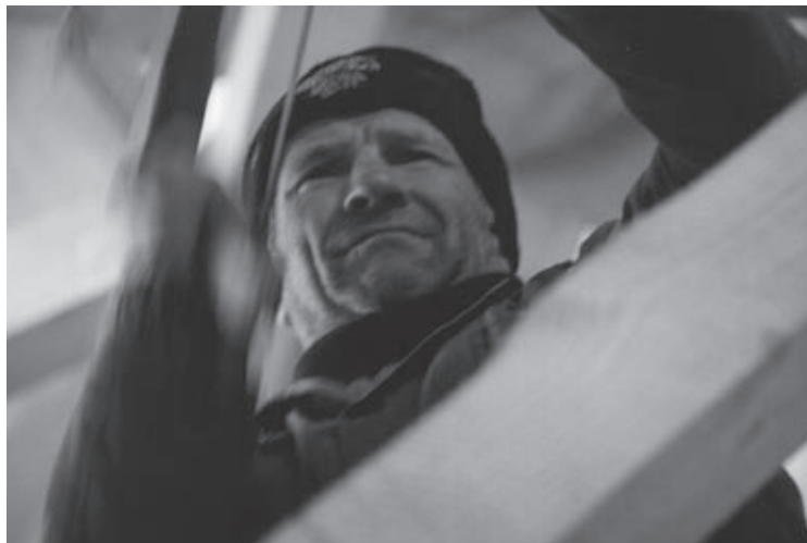
A faluházépítő szakemberek egyike. A szakembereket onnan hívta a polgármester Alsómocsoládra, ahonnan épületfa származik: Erdélyből.