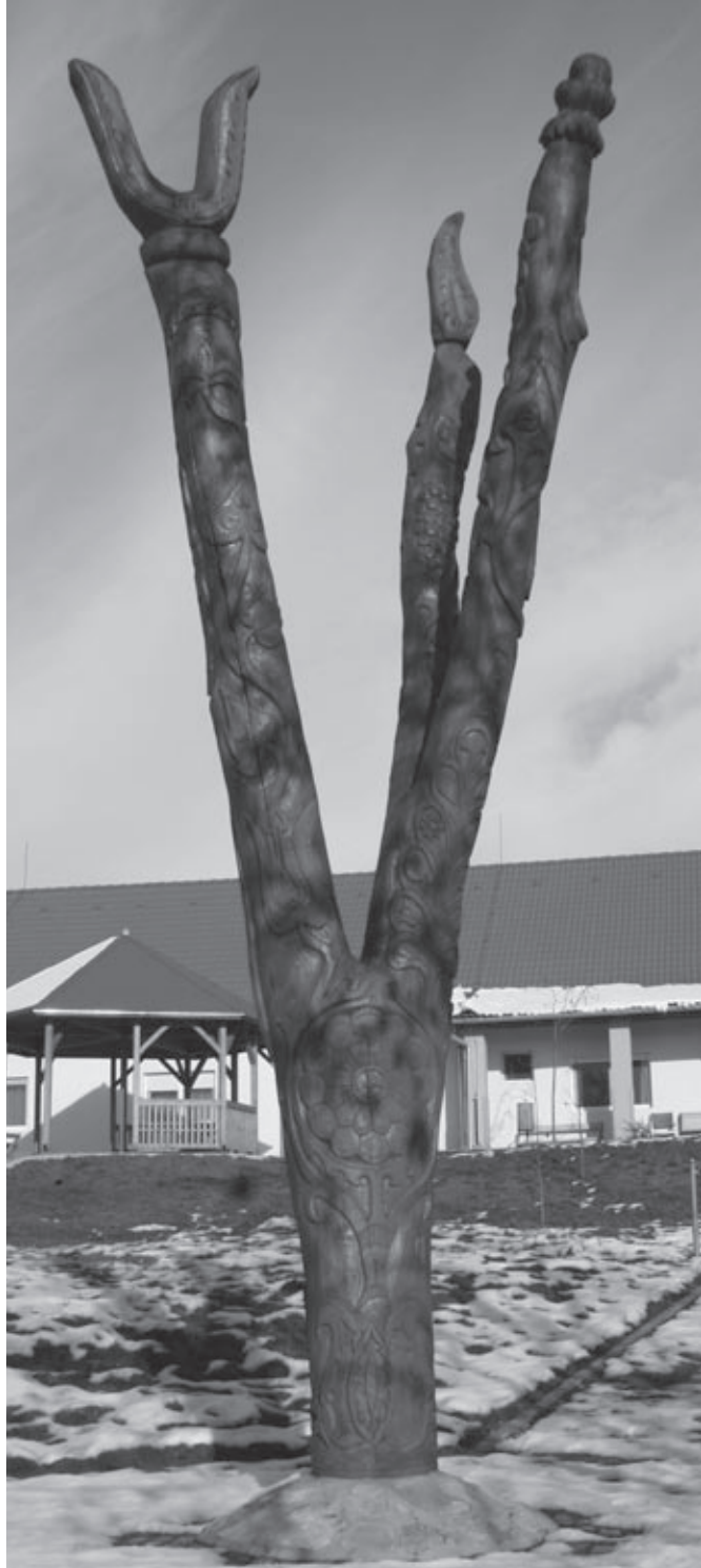
Az alsómocsoládi idősek otthonához tartozó szép park életfája

A mediátor segítségével tán túlságosan rövid idő alatt jutottunk el a problémafeltárástól a problémák valószínűsíthető okainak meghatározásáig, amitől, persze