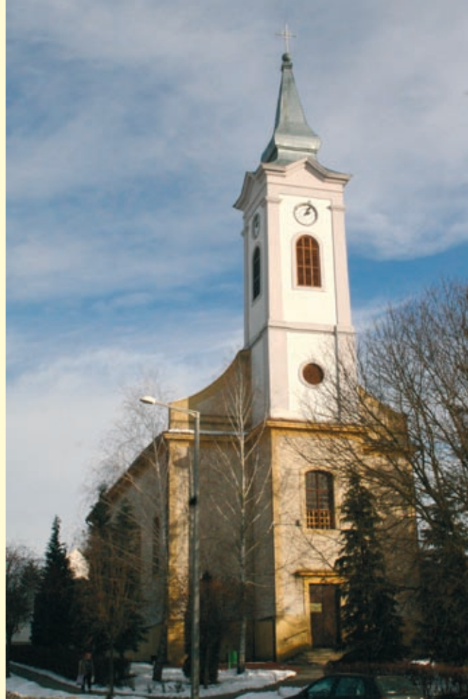
A helyi önkormányzatnak a templomtorony felújítására is futotta.

Az Alsómocsoládiak Baráti Köre összetartja és rendszeresen hazahívja a községből elszármazottakat. Az Ezüst Idő Énekkar őrzi tájegységünk dalait és adja tovább a fiataloknak, kézimunkáival rendszeresen megörvendezteti a közösséget. Az Élet az Éveknek Nyugdíjas Klub tagjai rendszeresen összejönnek, egymást segítik, és mindig szerveznek valamilyen érdekes programot vagy kirándulást, bizonyítva, hogy az emberi élet minden szakaszát lehet aktív és hasznosan tölteni. A Május Kugli Egylet a felhőtlen szórakozás szervezete. Fiataljaink aerobik- és tánckara ünnepeinket is színesíti. Civil szervezeteink te-