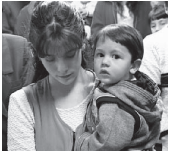
A nők jól öltözöttek, a gyerekek aranyosak. Tiszta a szemük és a lelkük. Azt éneklük: Méltó a bárány, hogy vegyen dicsőséget, hódolatot, áldást és tisztességet.

aztán többen közülük ebben a – leginkább a baptistákéhoz hasonló – gyülekezetben leltek vigaszra. Az istentiszteleteken hangosan és jókedvűen énekelnek, tapsolnak, a baptista halleluja helyett azonban a cigányos jáj, jáj keveredik a strófákba. Csodálkozni ezen nincs okunk, hiszen az Egyiptomból megszabaduló zsidók is dallal, tánccal, csörgőkkel dicsőítették az Urat, Istentől való ez öröm.