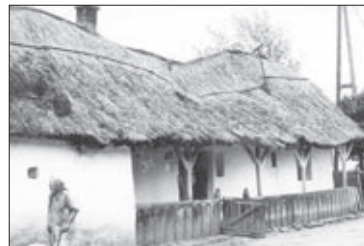
Nádttetős, szakalábas, tornács ház