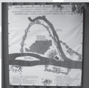
Az erőd egésze

A műemléki védettség és a felújítás mellett mindegyik erődrészt önálló térként, befogadó közegként definiálják a hasznosítást végző szervezetek. Az építmények különbö-