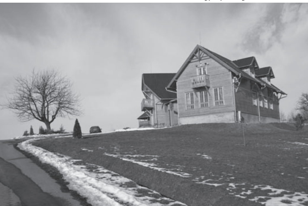
A falu dombján – amelyet a helybeliek a ráépült módosabb porták miatt Alsómocsolád Rózsadombjának is neveznek – legfelül magasodik a három éve épült faluház, amelyben helyet kapott a teleház, s abban a civil szervezetek. A kívül-belül fából készült épületben működik a körjegyzőség, az anyakönyvvezető – amit táblák jelölnek odakint –, a POLGÁRMESTERI HIVATAL azonban egyetlen ajtó felirata odabent.