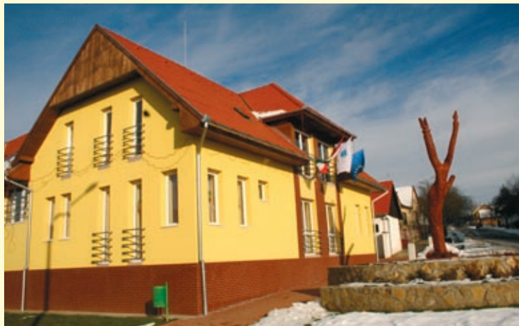
A korábbi művelődési és teleházat vendégházzá és konferenciaközponttá alakította az önkormányzat. Multifunkcionális közösségi tér kapott benne helyet.

A falubeliek közösségi mindennapjaikat a három évvel ezelőtt elkészült faluházban élhetik, amely otthont ad a körjegyzőségeknek, a teleháznak, a postának, a